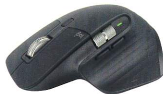
ロジケールのハイエンドマウス「MX MASTER 3S」

次はお気に入りのキーボードを探していますので、良いものが見つければ、また次回紹介したいと思います。